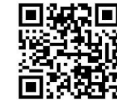
[入校条件と注意事項]