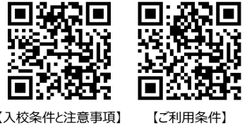
[入校条件と注意事項] [ご利用条件]