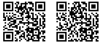
[入校条件と注意事項] [ご利用条件]